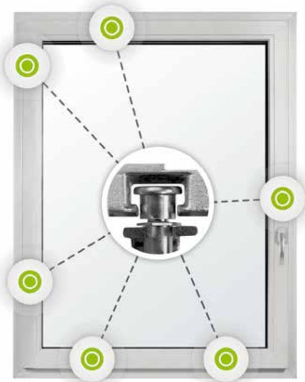
6-fach Sicherheit im Standard